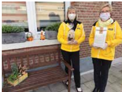
▲ De Wilrijkse N-VA-leden kregen onlangs een geschenkpakket. Een fijne attentie voor hen én voor de lokale middenstand.

Binnenkort bereiden we onze agenda van 2021 voor, uiteraard nog wel onder voorbehoud. We bekijken of we de activiteiten die we in 2020 planden, kunnen opnemen in het nieuwe jaar. Een historische wandeling in een van de Wilrijkse wijken zal zeker niet ontbreken en de wandelzoektocht door ons geitendorp is ook een niet