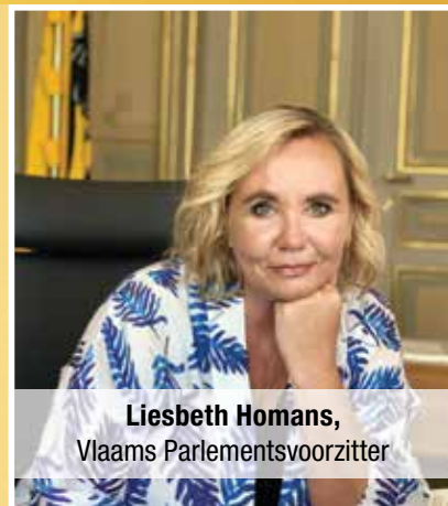
Liesbeth Homans, Vlaams Parlementsvoorzitter