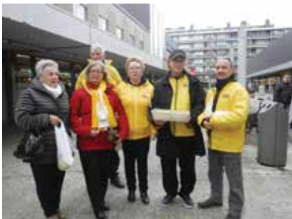
▲ In februari – voor het coronavirus Vlaamse bodem bereikte – deelden uit N-VA-bestuursleden chocolaatjes uit.

Het afgelopen jaar hebben we ondanks de coronamaatregelen toch enkele activiteiten kunnen organiseren. Zo deelden we in februari valentijnschocolaatjes uit en beloonden we op 11 juli iedereen die de Vlaamse Leeuw uithing met een voor de tijd toepasselijk accessoire. Recent schonken we onze leden een geschenkpakket. Op die manier steunden we ook de lokale middenstand.