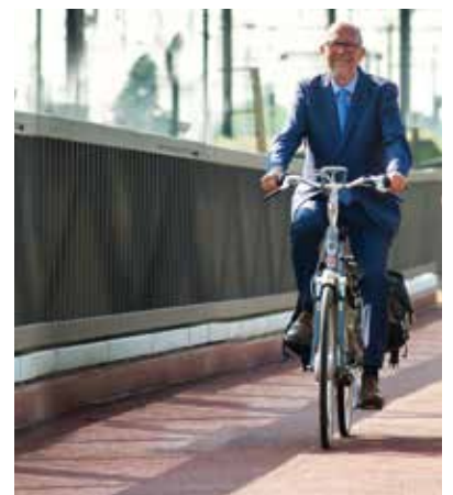
▲ Luk Lemmens, eerste gedeputeerde

Toch wordt er nu al gretig gebruikgemaakt van de F11. Tijdens het eerste trimester stonden er vlot 134.000 passages op de teller aan de bijzondere fietsbrug in Boechout. "Investeren in veilige, vlotte en comfortabele fietsinfrastructuur loont. Tot 2025 trekken we daarvoor 117 miljoen uit", besluit de gedeputeerde.