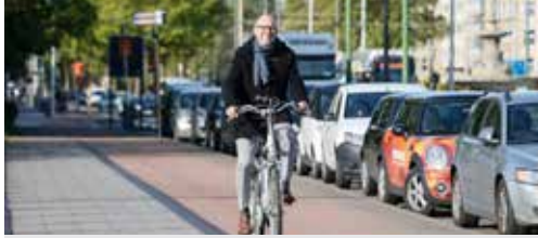
Provincie subsidieert fietspaden (p. 2)