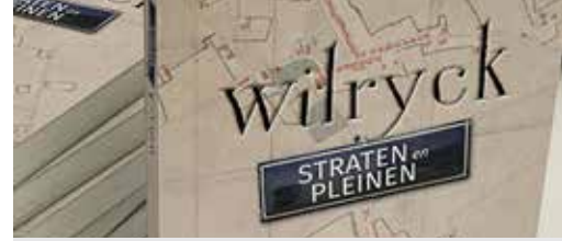
'Wilryck straten en pleinen' (p. 2)